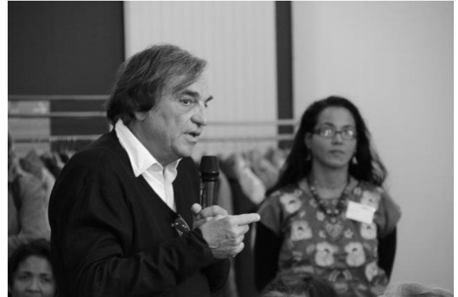
le Pr Marcel Rufo

http://www.gazette-sante-social.fr/actualite/actualite-generale-du-desir-d-enfant-a-la-realite-comment-accompagner-les-candidats-a-l-adoption-39532.html?recherche=1