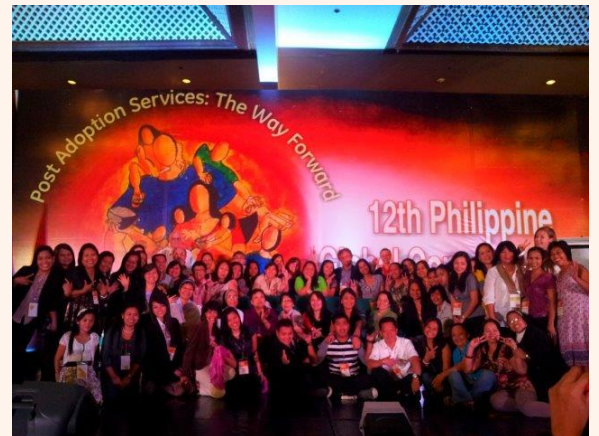
Congrès de consultation des pays partenaires des Philippines pour l'adoption d'enfants philippins

Le Congrès rassemblait le bureau permanent de la Convention de La Haye ainsi qu'une trentaine de pays, représentés par les agences d'adoptions mais aussi par leur Ambassade. La France comptait 2 opérateurs (AFA et MDM) ainsi que l'APPO PAEPAMA. Le thème principal de ce rassemblement était relatif au suivi post-adoption et la recherche des origines pour lesquels l'ICAB a invité les pays d'accueil à renforcer l'accompagnement des familles.